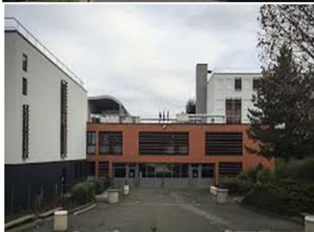
Le lycée avant-après